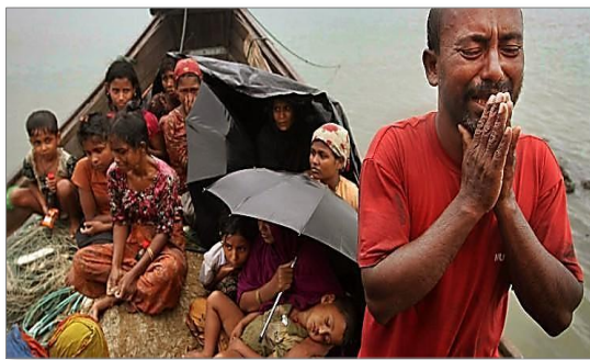
バングラディシュ側に逃れてきた ロヒンギャの人々