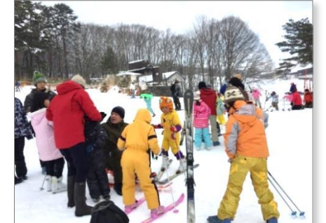
猪苗代で思いっきりスキーを楽しむ