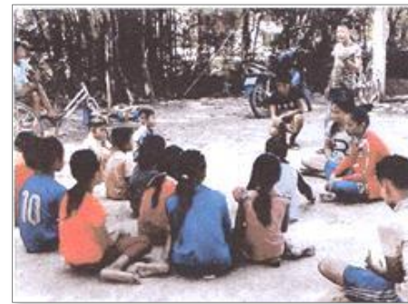
「子どもクラブ」で小さい子どもたちに子どもの権利や クメール語を教えるピア・エドゥケーター