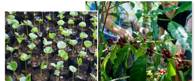
コーヒーの苗を植えて