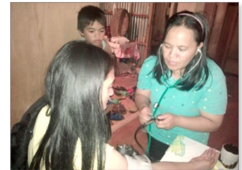
訓練を受けた村人が血圧を測る