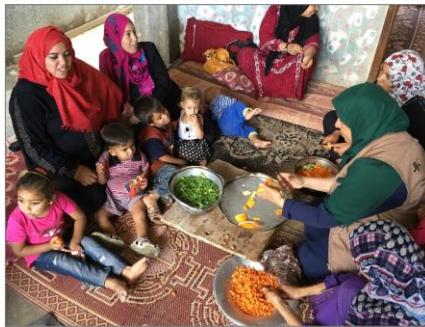
JVC スタッフによる食事指導