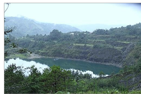
過去の鉱山開発により、汚染された 水が溜まっている