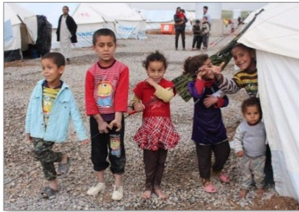
モスル解放作戦で避難してきた 国内避難民